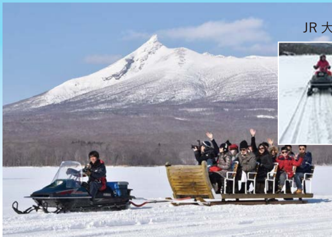
島めぐりそりツアー・氷上スノーモービル