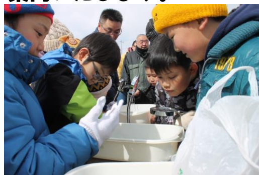
害虫を観察している様子