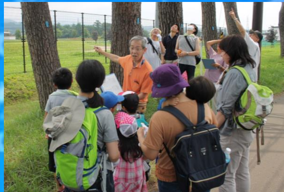
赤松を観察している様子

当日は、樹木医による、観察方法や七飯町の松についての説明を行いますので、初めての方や子ども連れの方も学習しながら参加できる観察会です。