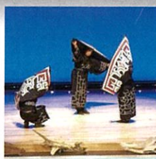
アイヌ民族舞踊団