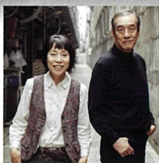
トワ エ モワ