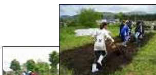
友の会の皆さんと作業中！

第2回目のジュニア探検クラブでは、西洋式農機具のプラウとハローを使い、畑づくりとマリーゴールドの種を植える作業をしました。プラウは、力加減がうまくいかず苦戦していましたが、コツをつかむとスムーズに進み出しました。ハローは、ハローの上に子どもが乗り、それを子どもたちで引っ張り耕しました。本来は、馬や牛に引かせて使用します。植えたマリーゴールドは、9月の草木染めで使う予定です。楽しみですね。