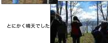
とにかく晴天でした