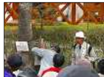
桜の木から、松の木が生えています！