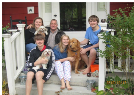
ホストファミリーのみんな ホームパーティーの様子