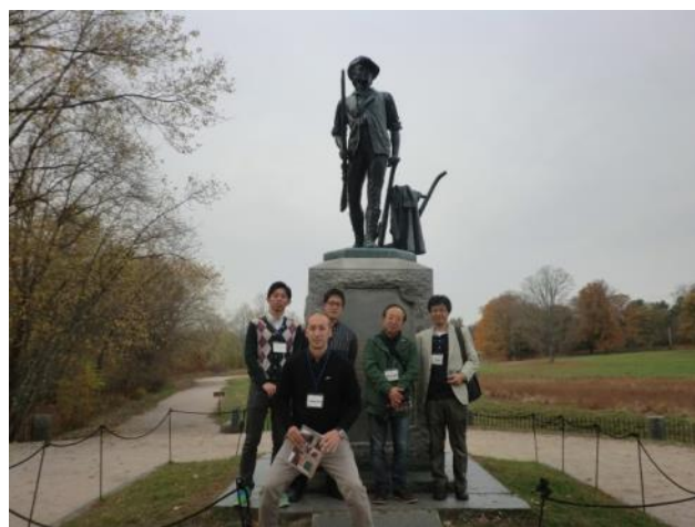
【ミニットマン国立歴史公園～ミニットマン像の前で】