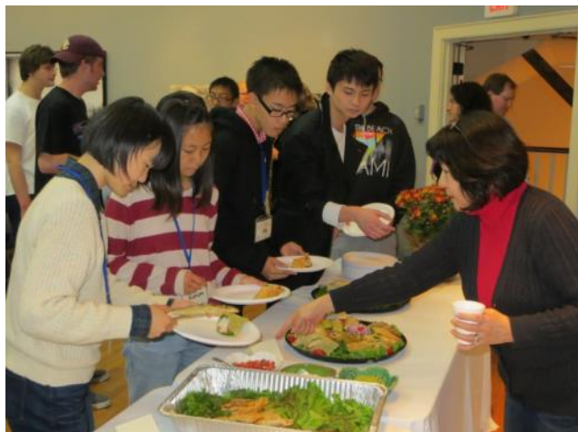
【歓迎会～料理を食べながら歓談しました】