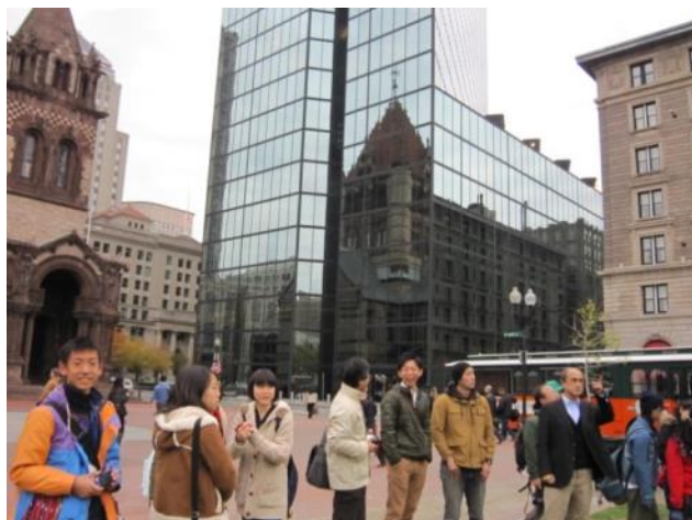
【ボストン市内観光～コープリースクエア】