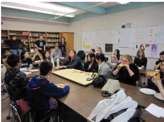
【サイファイクラブ歓迎会～ピザを食べながら一緒にアニメを観ました】