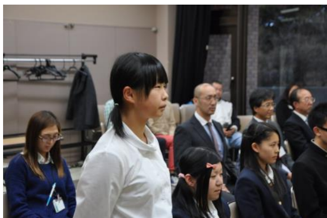
【壮行式～派遣者が決意表明をしました】