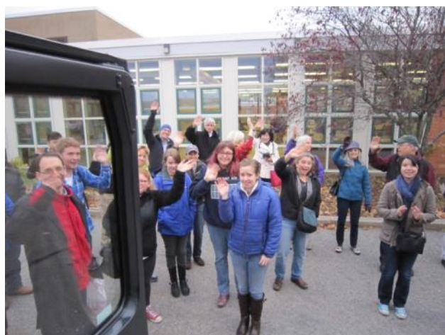
【コンコード出発～最後までみんな手を振りました】