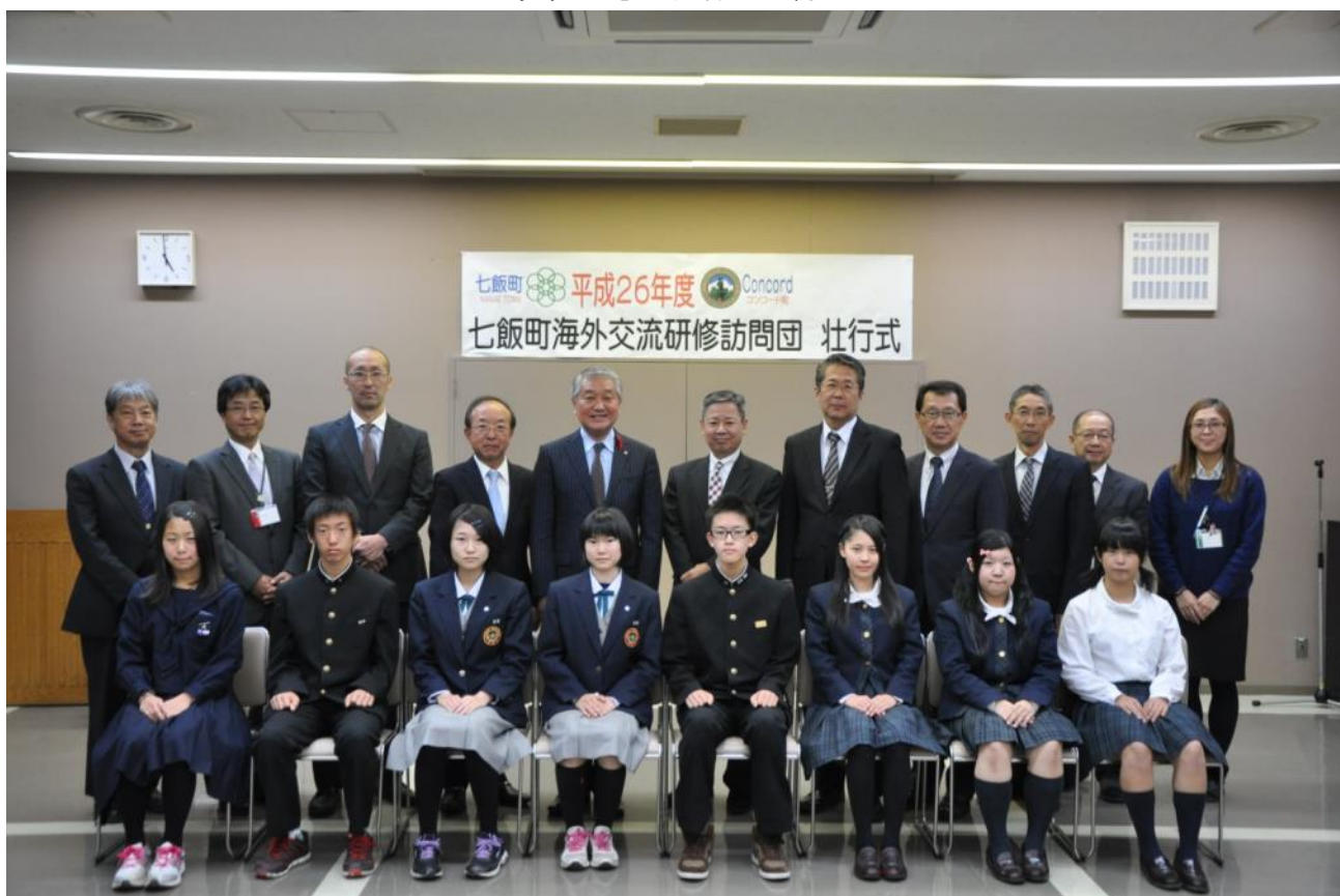
【壮行式～七飯町役場にて】