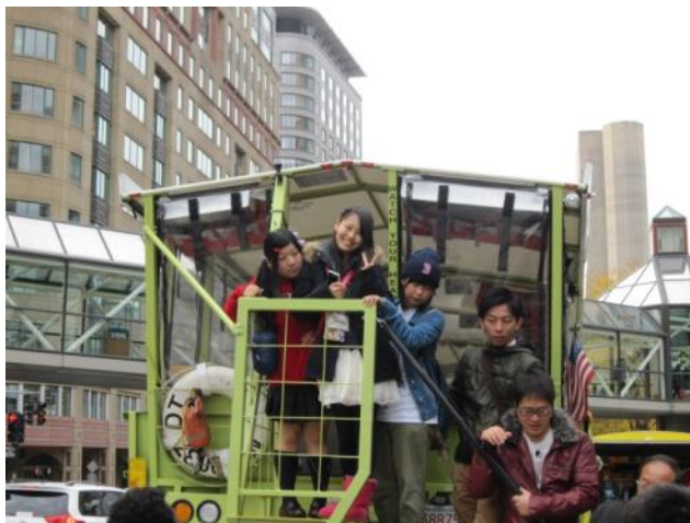
【ダックボートに乗り込む～ビニールに覆われたボートの中は意外と暖かったです】