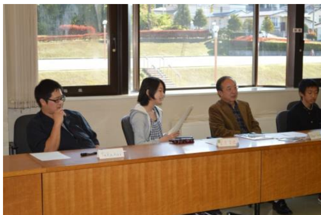
【第4回事前研修～ホームステイ先に英語でメールを書きました】