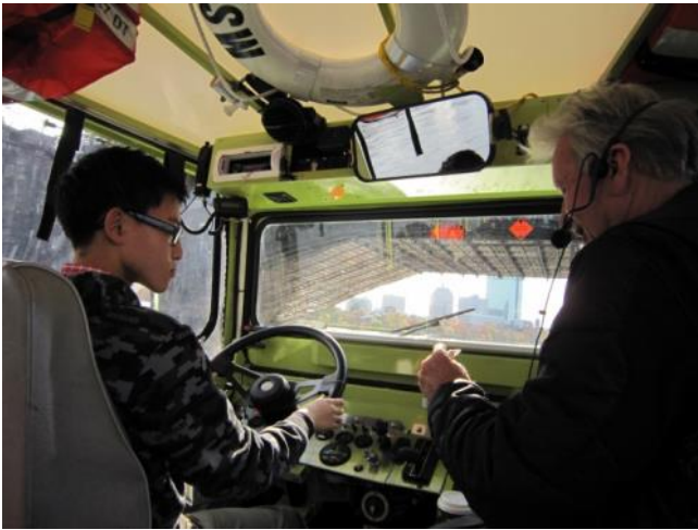
【ダックボートツアー～操縦に挑戦するとガイドさんがお土産にシールをくれます】