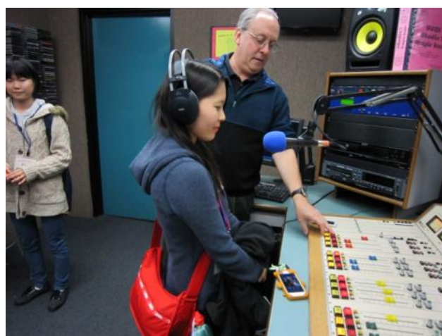
【生放送に挑戦～ネッド先生やラジオ局担当の生徒たちに教えてもらいながら出演】