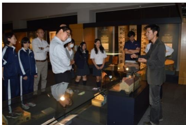
【第2回事前研修～七飯の歴史を学びました】