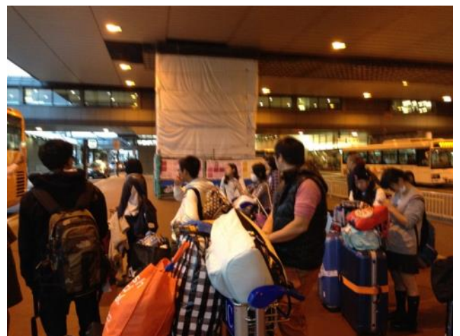
【成田空港到着～お土産もたくさん持って無事に日本に着きました】