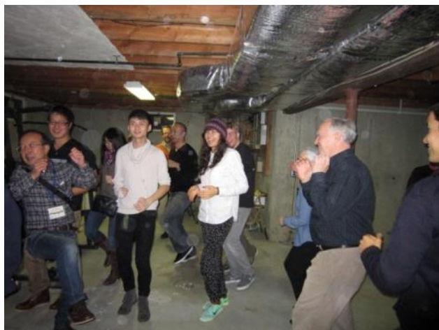
【いか踊り～パーティーの最後は恒例のいか踊りで盛り上がりました】