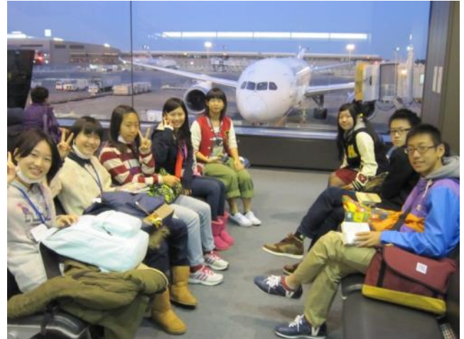
【成田空港～これから乗る飛行機と】