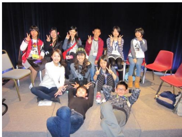
【CCHS テレビ局～他の留学生と一緒に撮影した番組はローカル放送されるそうです】