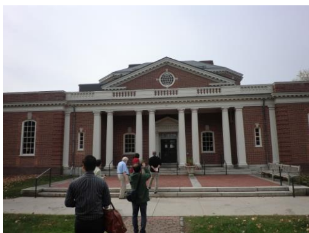
【コンコード公共図書館～外観も館内もとてもきれいです】