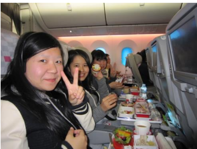
【帰りの機内にて～バニラアイスが出ました】