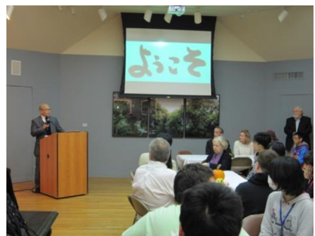
【歓迎会～セレクトマンの議長が歓迎の挨拶を してくれました】