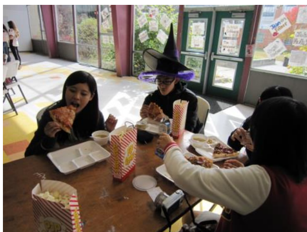
【広いカフェテリア～この日はハロウィンで特別にポップコーンもありました】