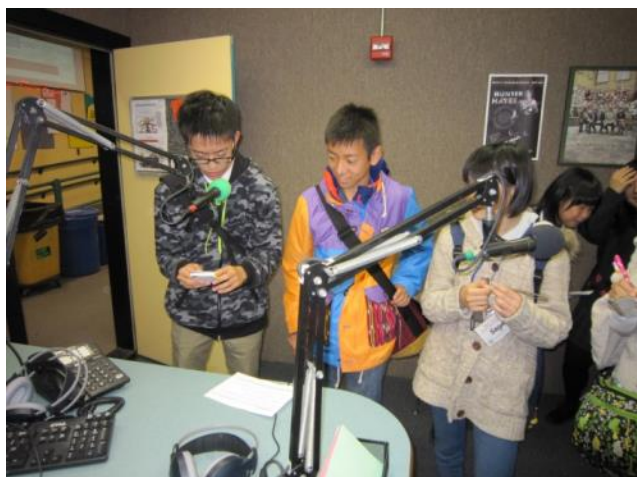
【CCHS ラジオ局～校内には生徒が運営するラジオ局があります】