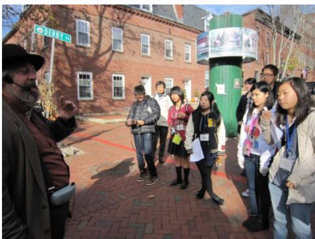
【セーラム市ツアー～ガイドさんの案内を受けながら市内を散策しました】