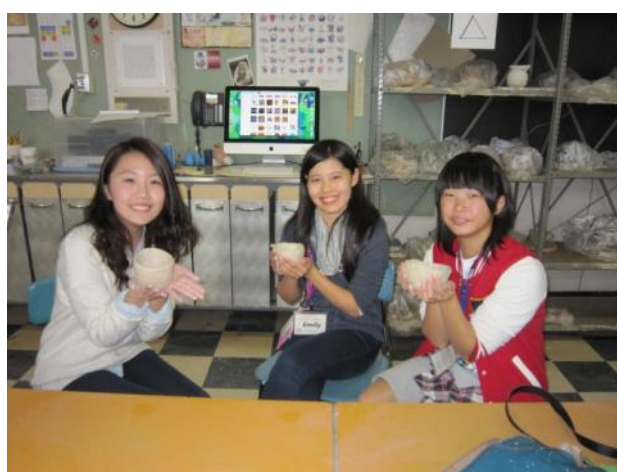
【美術教室にて～陶芸の授業で実際に作らせてもらいました】