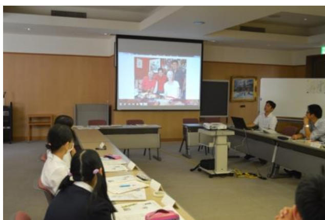
【第2回事前研修～過去の交流の様子を写真で見ました】