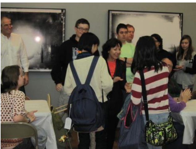
【コンコード到着～美術協会で開催された歓迎会 でファミリーと対面しました】