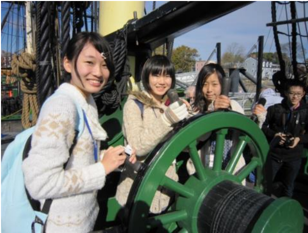
【貿易船フレンドシップ号見学～船内も当時のように再現されていました】