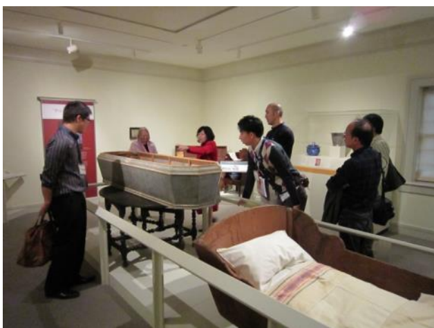
【コンコード美術館～「眠り」についての特別展示を見学しました】