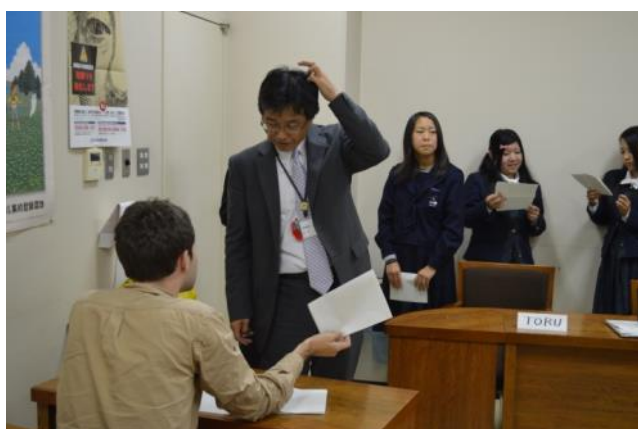
【第5回事前研修～入国審査の練習を実践形式で】