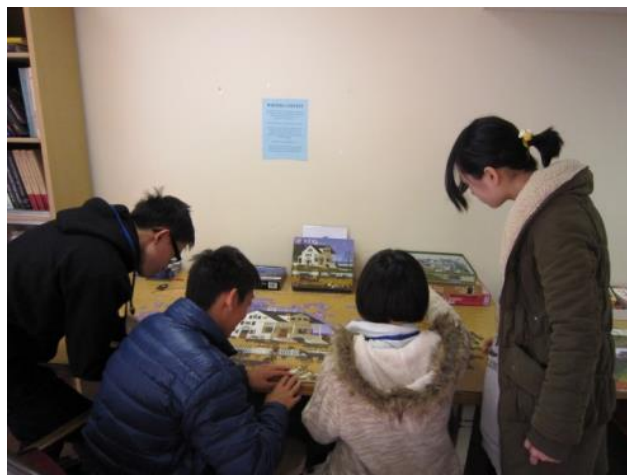
【CCHS 図書館～朝の集合場所だった図書館にはジグソーパズルなんかもありました】