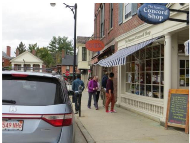
【コンコード中心地区散策～かわいい小さなお店が軒を連ねます】