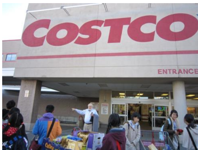
【卸売りの店コストコ～お土産をたくさん買いました】