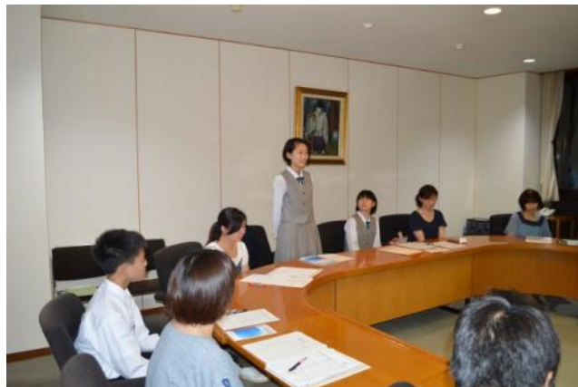
【第1回事前研修～自己紹介】