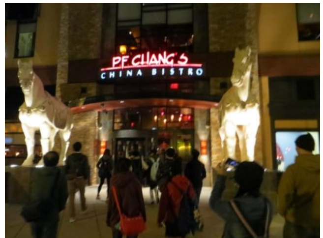
【ボストン最後の夕食～アメリカの中華料理を食べました】