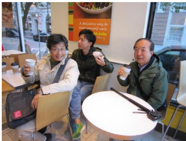
【ハーバード大学近くのパン屋さん～とても寒い朝だったので温かい飲み物で一休み】