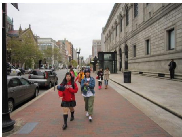
【ボストン市内観光～ニューベリー通り】