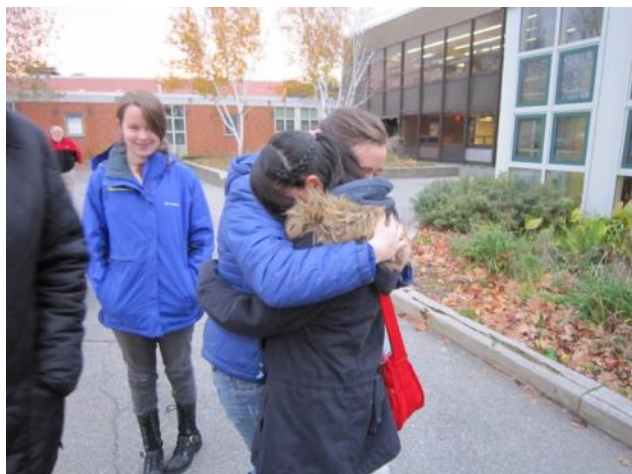
【出発の朝～ファミリーとの別れは辛かったです】