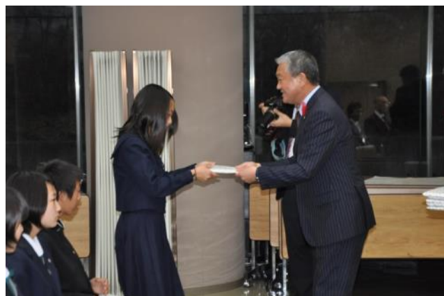
【壮行式～町長からファミリーへのお土産をもらいました】