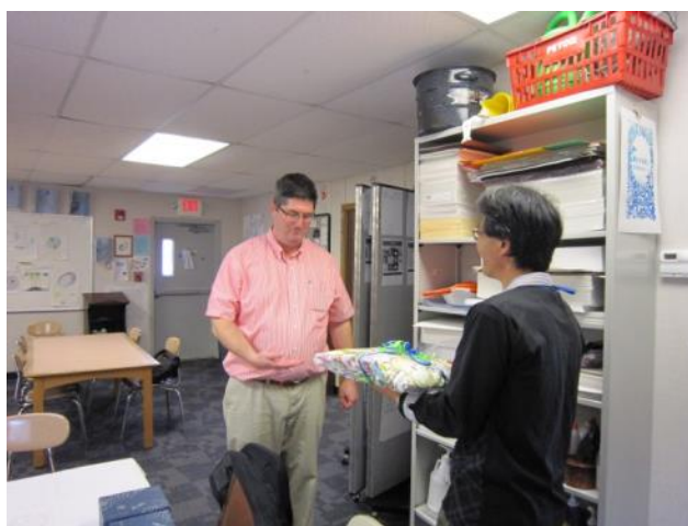
【CCHS の歓迎昼食会～バダラメント校長からお土産をいただきました】