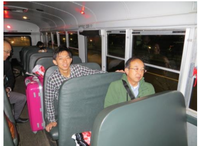
【空港からコンコードへ～スクールバスで移動 しました】