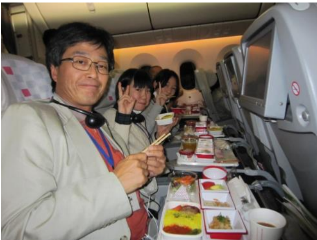
【機内にて～機内食は軽食も含めて3回ほど出 ました】