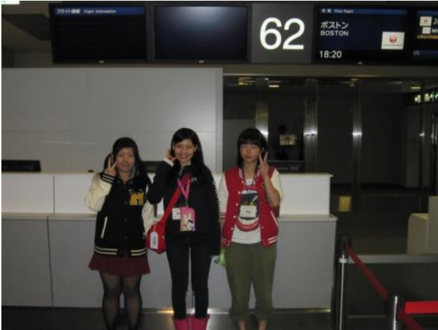
【成田空港～出発ゲート前で】