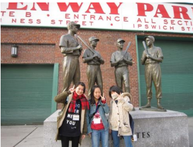
【フェンウェイパーク球場～シーズンオフでしたが球場の周りやお土産屋などを見学】