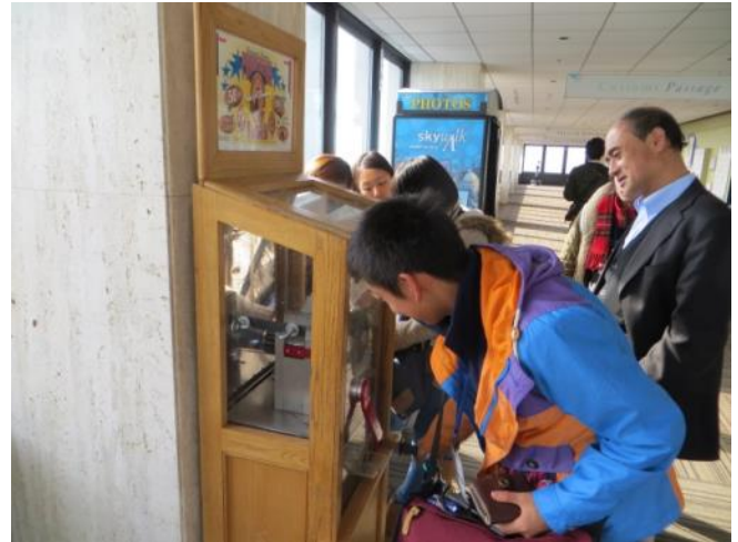
【展望台スカイウォークにて～1セント硬貨に印字して記念硬貨を作る機械】