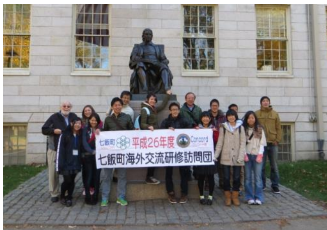
【ハーバード大学見学～ジョン・ハーバード像の前で】