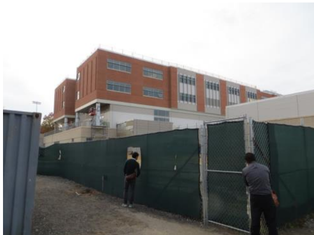
【コンコードカーライル高校～現校舎の裏手に来春完成予定の新校舎が見えます】