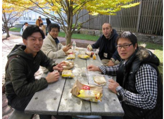
【埠頭近くの公園にて～七面鳥とハムのサンドイッチでピクニック風の昼食】