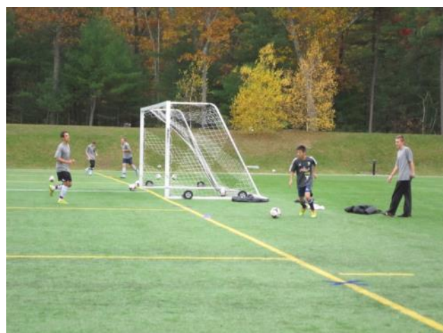
【サッカー部～放課後にサッカー部の練習に参加させてもらいました】