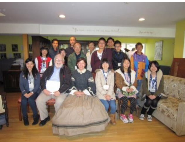
【オーチャードハウス～ジャンさんを囲んで】