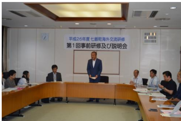
【第1回事前研修～町長から挨拶】