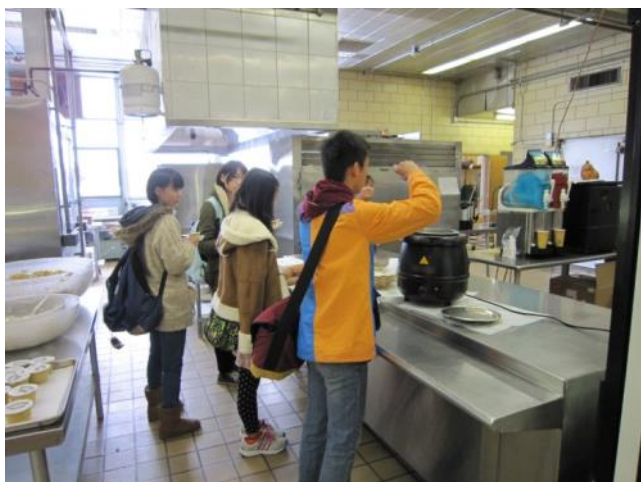
【高校カフェテリアのキッチン～温かいスープやピザなど食べたい物を自分たちで選んで取ります】