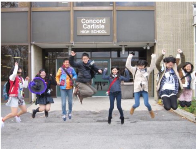
【高校の正面入り口にて～ハロウィンの朝】