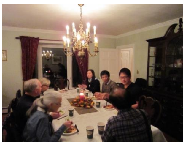
【キンボールさんの家にて～全部のファミリーが集まりパーティーを開いてくれました】