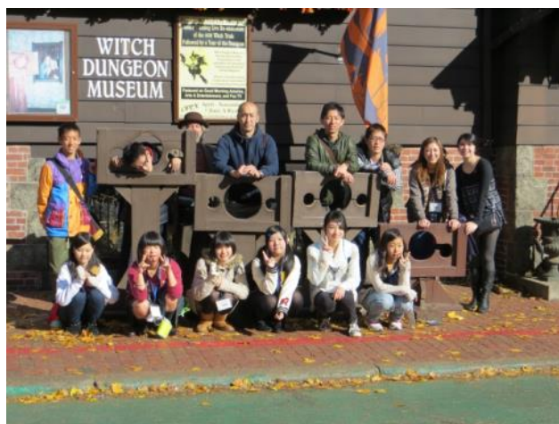
【魔女博物館～中には入りませんでしたがガイドさんも一緒に記念撮影】