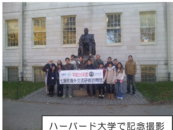
ハーバード大学で記念撮影

そして7日目、派遣者全員でハーバード大学を観光してきました。とても広く、建物も大きかったです。銅像の左足にも触ってきました。みんなそこだけ触るので、左足だけ剥げていました。また、ハーバード大学の生協でお土産を買い、コストコでもお土産を買いました。この日は最後の夜だからなのか、ホストファミリーに日本食レストランへ連れて行ってもらいました。そこで食べたスパイシー枝豆の辛さは二度と忘れないです。一見普通のお寿司だけど、日本とは全然味がちがいました。特に印象に残ったのはイクラが無味だったことです。でも連れて行ってもらえて嬉しかったです。家に帰ってから地下室があることに気づき、下りてみると広く、ビリヤードや卓球台、スキー板やレゴが大