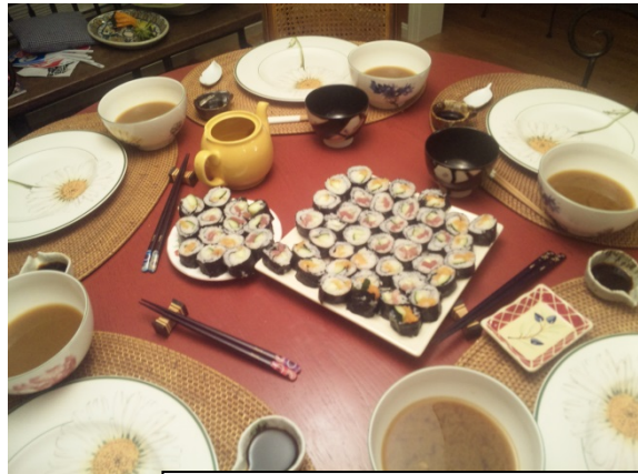
大好評だった手巻き寿司♡

日曜日は、初雪が降りとても寒かったです。家族でボストンの教会に行きました。オルガンの演奏や聖歌隊の歌には鳥肌が立ちました。礼拝を終えてから、ショッピングモールでお土産を買い、スーパーでは夕食の材料を買いました。この日の夕食は私の手料理の手巻き寿司で、口に合うか心配だったけど「delicious!」と言ってくれて嬉しかったです。また、お土産を渡したら、ウチワにホストファミリーの名前を漢字で書いた物を一番喜んでくれていました。