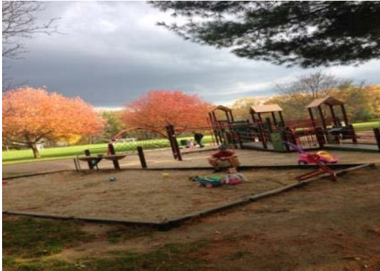
コンコードの公園にて