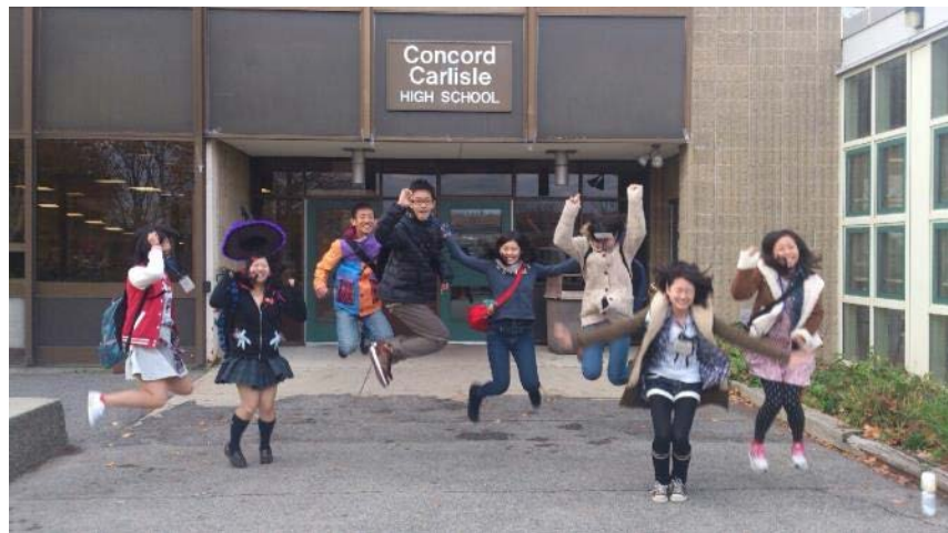
ハロウィーン当日、 CCHS にて