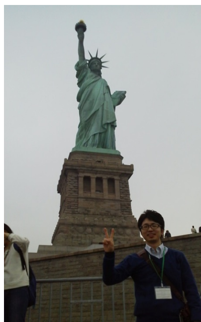
迫力ある自由の女神

6:30にホストファミリーの車でバスの出発場所に着き、ホストファミリーとの別れを惜しみつつ、ニューヨークに向けて出発しました。コンコードから約4時間かかりましたが、無事にニューヨークに到着。セントラルパークや国連などを見て回りました。目に飛び込んでくる景色のすべてがコンコードやボストンとまったく違ったので、ニューヨークの町に圧倒されたことを今でも覚えています。昼食後、ロックフェラーセンターや自由の女神などの有名観光スポットの観光をしました。間近で見た自由の女神は迫力があり、何枚も写真を撮りました。18:30の夕食後、タイムズスクエアにある何件かのお店(服屋・雑貨屋など)に寄り、買い物をしました。お店では、店員との通訳をし、楽しく買い物できたと思います。