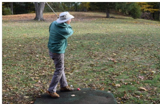
庭でのゴルフ練習

一番不安だったのは、片言でしか話せない英語での会話でしたが、理解できるまで何度も繰り返し繰り返し話してくれて、時には辞書や携帯を使いながら問題なく過ごすことが出来ました。食事に関してアメリカのイメージは、肉がメインで脂っぽい物を多く食べているイメージでしたが、ホームステイ中