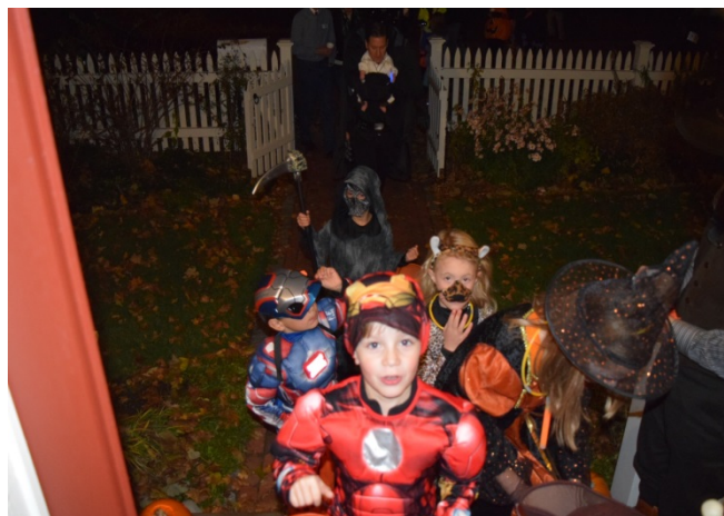
ハロウィンパーティー 可愛い子供達

コンコード滞在中は、アメリカ独立戦争の舞台である「オールド・ノースブリッジ」、そこで新聞記者という男性から少しインタビューを受け、今なお注目度の高さがうかがえました。日本でも有名な若草物語を書いた、ルイーザ・メイ・オルコットが住んでいた「オーチャードハウス」、ここでは、ルイーザ本人に扮した