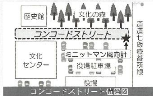
コンコードストリート位置図

米国・マサチューセッツ州コンコード町と七飯町は、今年で姉妹都市提携20年を迎えました。コンコード町からは19名の記念訪問団が11月1日から6日までの日程で来町し、ホストファミリー9家庭のご協力もいただきながら、20年を記念する行事が行われました。コンコード町と七飯町は、平成4年12月、北海道の地域内市町間交流拡大事業の一環として七飯町がコンコード町の紹介を受けたことを契機として、交流が開始されました。その後、文通や相互訪問などを通じて交流を深め、平成9年11月に5年間の姉妹都市提携を調印。5年毎に再盟約を交わしながら、頻繁な相互訪問や七飯町への国際交流員の招致などを通じて両町の絆はますます深まり、20年という節目を迎える