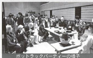
ポットラックパーティーの様子