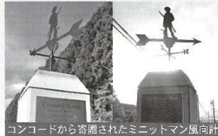
コンコードから寄贈されたミニットマン風向計