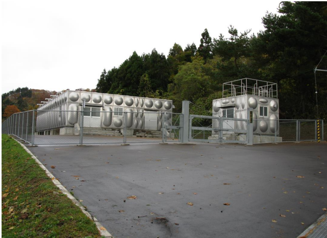
藤城第 3 配水池全景