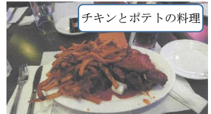
チキンとポテトの料理

この日は自由の女神像を見学後に昼食。アメリカらしいボリュームのある料理でした。その後に行った国連本部は、普段閉まっているカーテンが偶然開かれていて、運よく会議場を見ることができました。