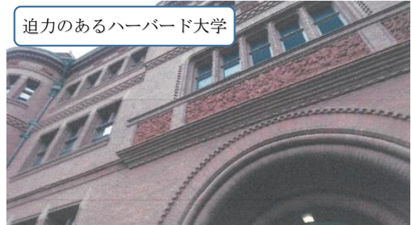
迫力のあるハーバード大学

この日はボストンに行きました。見上げる程高く、ガラス張りの立派な建物が多くあるという印象が強い街でした。世界的に有名なケンブリッジ市のハーバード大学は、目の当たりにすると歴史的で感慨深かったです。