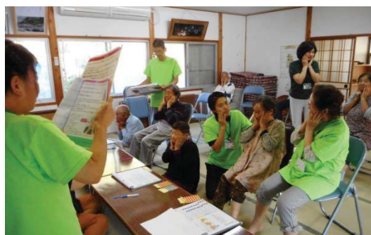
普段の活動のようす