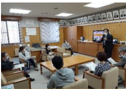
学校運営協議会の様子

5月6日(木)に今年度最初の学校運営協議会、5月20日(木)にはPTA三役と地域子ども会長にお集まりいただき、三者協議会を開催しました。 コロナ禍だからこそ、子どもたちが笑顔で学校に通えるようにできることを話し合い情報を共有することができました。貴重なご意見をありがとうございました。