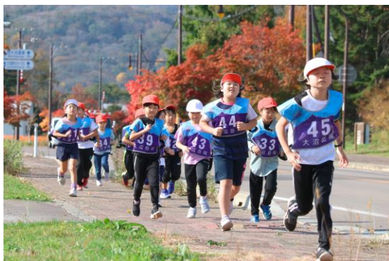
【マラソン大会の1コマ】

大会運営への協力やたくさんの声援をいただいた保護者の皆様、地域の皆様、ありがとうございました。今後ご支援をどうぞよろしくお願いいたします。