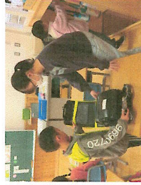
オセロや将棋を楽しむ子供たち