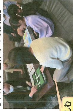
【中休み。昼休みの校長室】