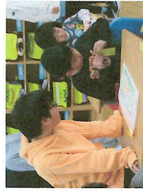
「やってあげる」ではなく、「やさしく見守る」6年生の姿が、とてもできてます!