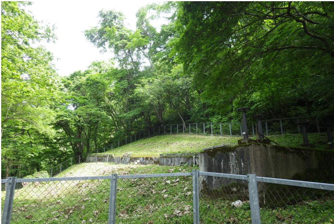
大中山第1水源全景