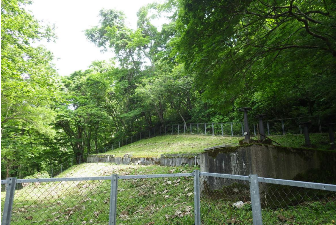
大中山第1水源全景