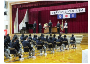
入学式の様子(左)と1年団紹介(右)