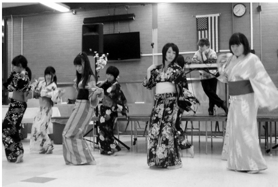
歓迎バーベキューパーティーにて日舞を披露 (CCHSカフェテリア)

が自分の目や耳で直接体験することは計り知れない素晴らしい経験であり、生涯において大変貴重な財産になったことでしょう。 この訪問団を受け入れていただくにあたり、事前の準備から滞在中の引率など、CCNNのメンバー、ホストファミリーの皆さんをはじめ、コンコード町の方々に心より感謝申し上げます。 来年は姉妹都市提携から15周年という記念の年を迎えますが、これまでの姉妹都市交流のあゆみを振り返り、両町がお互いの文化や志を高め、さらに世界平和のため、より一層の友好関係を続けてまいります。 ※CCHS⇨コンコードカーライル高校 ※CCNN⇨コンコードカーライル七飯ネットワーク