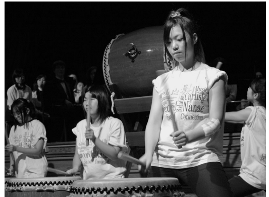
和太鼓披露 (CCHS音楽ホール)

滞在中は、全員がホームステイをして交流を深めた他、七飯高校吹奏楽局はコンコードカーライル高校コンコードバンドとの合同の演奏会、全校生徒へのコンサート、小学生へのコンサートなど計4回の演奏会を開催。コンサートのオープニングには、七飯高校生徒による和太鼓の演奏も披露し、観客から盛大な拍手をいただきコンサートは大成功。多くのコンコード町民へ感動を与えました。緊張の中にも精一杯実力を出し切りやり遂げられたことは、参加した生徒にとって今後の人生の大きな糧となりました。