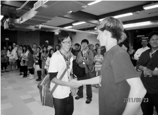
ホストファミリーと対面 (CCHSカフェテリア)

七飯町海外交流派遣研修訪問団14名と七飯高校姉妹校交流訪問団59名の総勢73名が9月23日から10月4日(七飯高校は10月2日)までの日程で姉妹都市コンコードを訪問してきました。今回は平成9年に七飯町とコンコード町が姉妹都市提携を結んで以来、最大の訪問者数でより多くのコンコード町の方と交流を深め、参加者たちはたくさんさんの思い出と友情をお土産に七飯に戻りました。