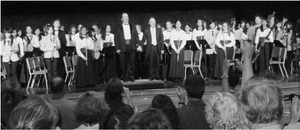
合同コンサート (CCHS音楽ホール)

滞在中は、全員がホームステイをして交流を深めた他、七飯高校吹奏楽局はコンコードカーライル高校コンコードバンドとの合同の演奏会、全校生徒へのコンサート、小学生へのコンサートなど計4回の演奏会を開催。コンサートのオープニングには、七飯高校生徒による和太鼓の演奏も披露し、観客から盛大な拍手をいただきコンサートは大成功。多くのコンコード町民へ感動を与えました。緊張の中にも精一杯実力を出し切りやり遂げられたことは、参加した生徒にとって今後の人生の大きな糧となりました。