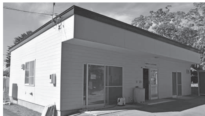
さくら共同作業所