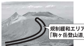
規制緩和エリア 「駒ヶ岳登山道」

また、七飯町公式LINE【裏表紙参照】をスマートフォンにインストールしておけば、登山中でも気象台が発表する火山噴火情報（噴火警戒レベルの発表等）が入手可能ですので、入山の際は是非ご利用ください。