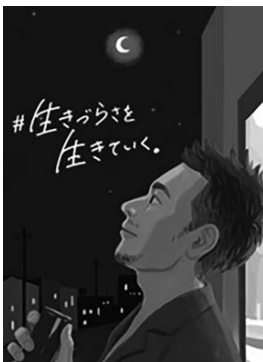
犯罪や非行を防止し、立ち直りを支える地域のチカラ