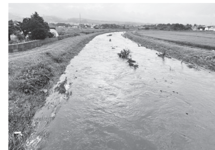
河川の増水の様子