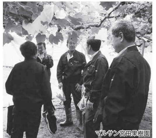
マルサン高田果樹園

今回の視察研修では、農福連携による農産物の生産・加工を行っている農地所有資格法人、北海道新幹線トンネル工事現場等を現地視察しました。