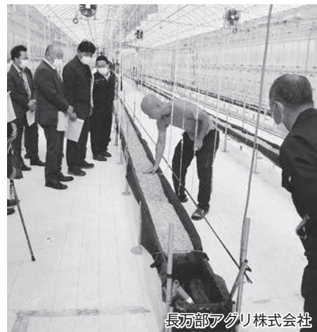
長万部アグリ株式会社

今回の視察研修では、農福連携による農産物の生産・加工を行っている農地所有資格法人、北海道新幹線トンネル工事現場等を現地視察しました。