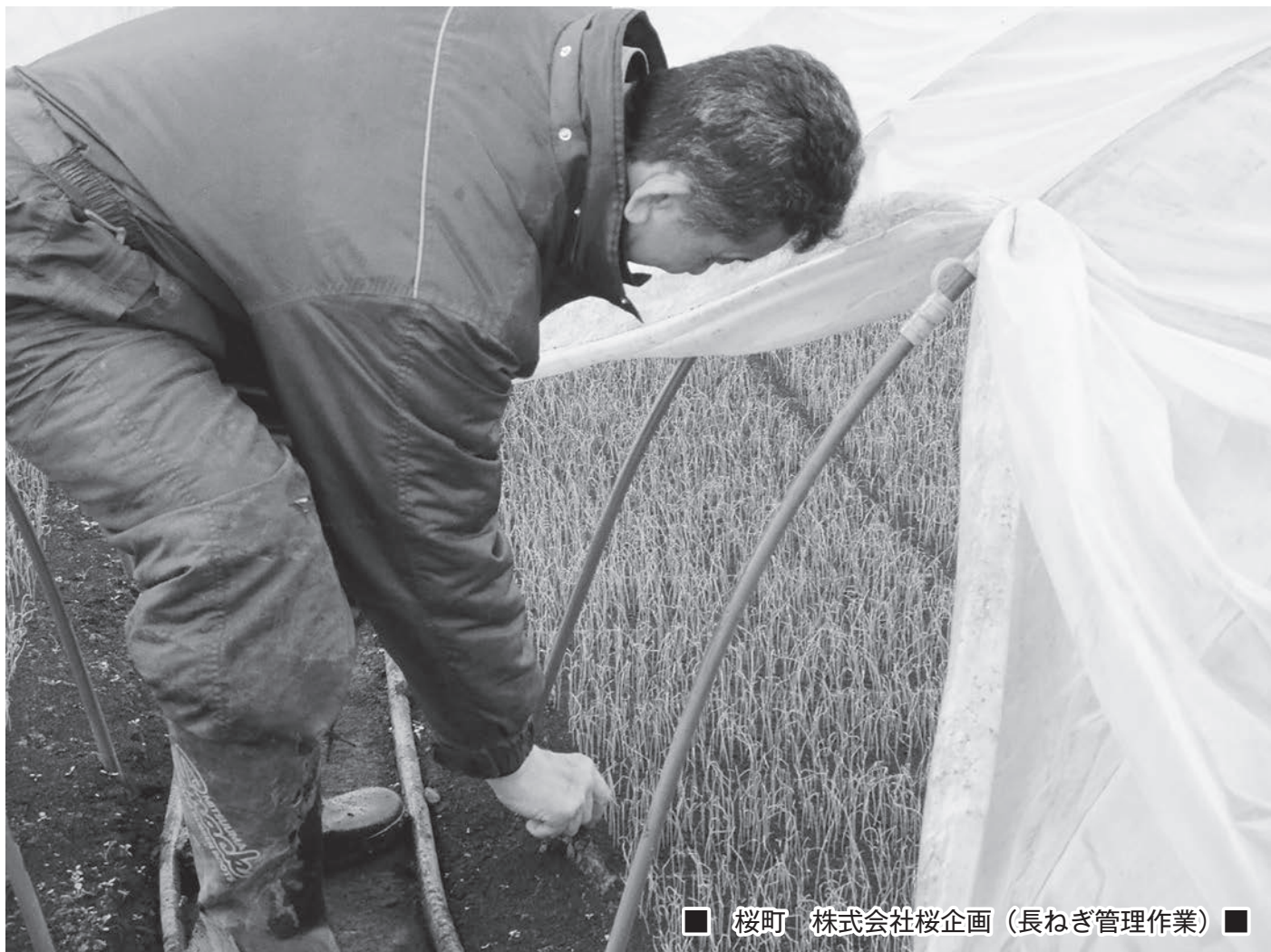
■ 桜町 株式会社桜企画（長ねぎ管理作業） ■

総会は、農業委員会が処理すべき事項を審議あるいは協議し決定する場で、通常月1回開催されます。