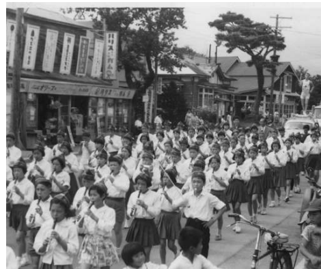
昭和39年 本町セブンイレブン付近聖火リレーの様子

歴史館では、七飯町の歴史を後世に残すため、町内の風景や街並みなどを撮影した古写真を探しております。時期としては、明治から昭和時代の写真をお持ちの方で寄贈、もしくは複写させていただける方は、下記までご連絡ください。