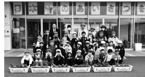
5月21日 大中山小学校 2年1組