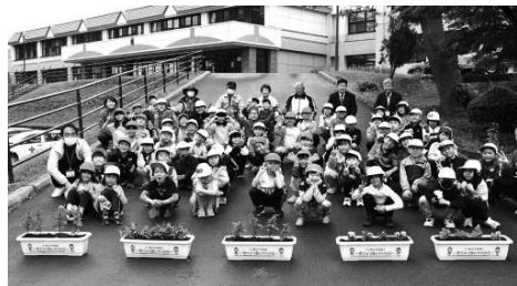
5月30日 七重小学校 2年生

プランターに植えた花々の成長を児童らが見守るなかで、優しさや豊かな心が育まれてゆくことを願っております。