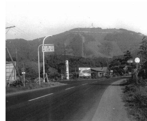
昭和40年 峠下バス停付近の様子