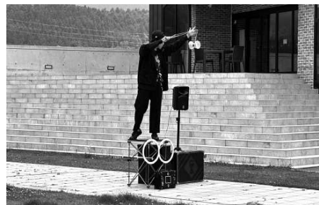
7月16日は【なないろの日】 第2回なないろの日 ～ミニ縁日で夏満喫～ が開催されました