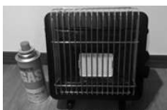
カセットガス使用