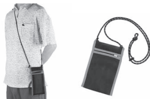
ポーチのふちやストラップが反射材に 肩から下げて邪魔になりません

なお、予約や整理券の配布ではなく、先着500袋限定で、在庫が無くなり次第終了致しますので、ご了承願います。