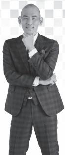
歌手：木山 裕策 氏

※1 会場の駐車場には限りがあります。無料シャトルバスが運行されますのでご利用ください。 ※2 イベント内容等は変更される場合があります。