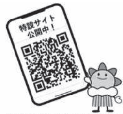
8月26日は火山防災の日

また、七飯町が発信する火山噴火に関する情報や避難情報は、防災行政無線や公式LINE、緊急速報メール等で発信しますので、戸別受信機の利用や、スマートフォンのLINE登録をお願いします。