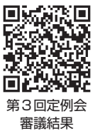
第3回定例会 審議結果