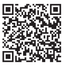
第4回定例会 審議結果

また、総務経済常任委員会及び民生文教常任委員会から報告書の提出があったほか、関係機関へ要請する意見書1件を審議し、原案のとおり可決されました。