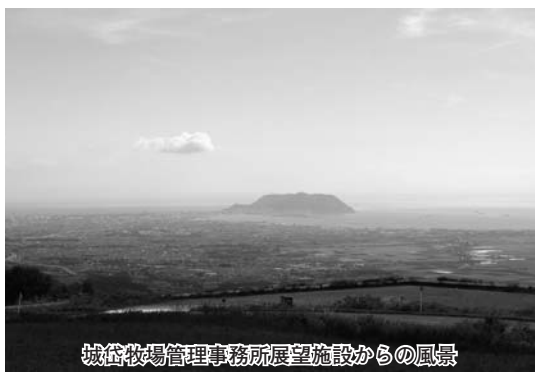
城岱牧場管理事務所展望施設からの風景

また、町内特産品の販売については、アンケート調査の内容等により、販売事業者や生産者等の協力が得られれば、販売可能なものから実施したいとのことである。