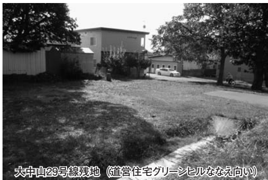
大中山29号線残地（道営住宅グリーンシビルなえ向い）

可能であるが、敷地には旧中島川の河川敷（法定外公共物として国から譲与済）があることから、一体的に取り組む必要がある。