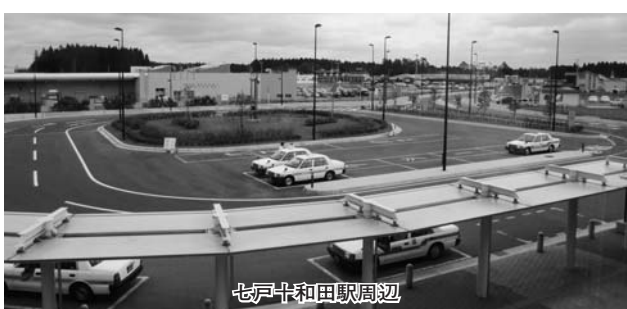
七戸十和田駅周辺

駐車場として61台分を確保している。 その他の駅舎周辺施設としては、道の駅しちのへ・農産物直売施設、美術館、山車展示館のほか、平成23年9月に大型商業施設がオープンしている。