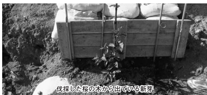
伐採した桜の木から出ている新芽

グラウンド等外構工事において、国道からグラウンドに進入する位置の変更、現駐車場の出入口の幅等の設計変更を行い、併