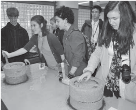
町歴史館にて石臼体験