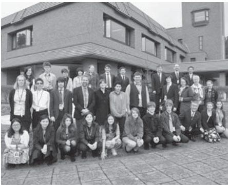
役場前にて記念撮影