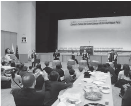
ポットラックパーティ

姉妹都市、アメリカ・マサチューセッツ州コンコード町から高校生を中心とする訪問団29名が去る4月10日から14日までの日程で来町し、ホストファミリー26家庭にご協力をいただき27名がホームステイをする中で、たくさんの方との交流を深めました。滞在期間中は、茶道、着物体験、お寺での座禅体験や町内外の観光地を見学するなど、多くの日本文化を体験しました。 また、姉妹校である七飯高校との